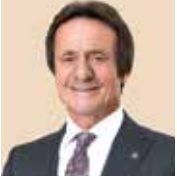
Ahmet Nazif Zorlu Yönetim Kurulu Başkanı

1944 yılında Denizli'nin Babadağ ilçesinde doğan Ahmet Zorlu, çalışma hayatına erken yaşlarda, baba mesleği olan tekstille başladı. İş hayatının ilk yıllarında Trabzon'da açtığı mağazayla tekstil ticareti yapan Zorlu, 1970 yılında şirketin merkezini İstanbul'a taşıyarak Zorlu Holding'in temellerini attı. 1976 yılında ilk üretim şirketi olan Korteks'i kuran Ahmet Zorlu, tüm şirketleri 1990 yılında Zorlu Holding çatısı altında topladı. 1994 yılında Vestel markasını Zorlu Holding bünyesine katan Ahmet Zorlu, yeni iş alanlarının da yolunu açtı. Zorlu'nun tekstil sektörüyle başladığı girişimciliği; beyaz eşya, elektronik, gayrimenkul, enerji, metalürji, savunma gibi birçok farklı alanda faaliyet gösteren şirketlerle devam etti.